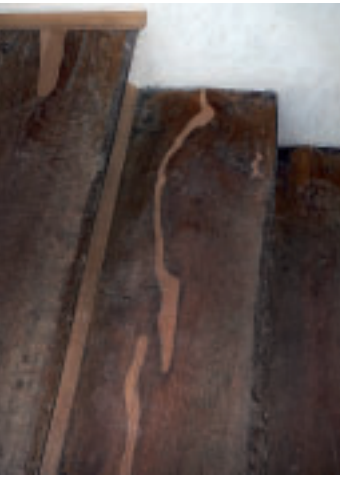
6 Treppe mit den deutlich erkennbaren Reparatursätzen.

den zusammen mit dem Putz gesichert. Mit Rücksicht auf die Einheitlichkeit des Raums entschied man dagegen, die Relikte zu zeigen, und versah alle Wände statt dessen mit einer neutralen Weißfassung.