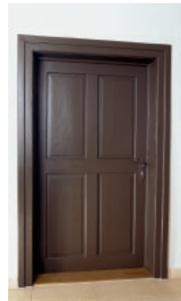
5 Historische Tür nach der Reparatur.