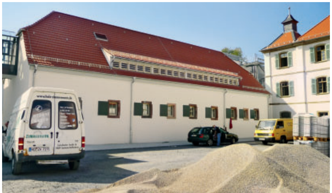
11 Das umgebaute Wirtschaftsgebäude während der Sanierung.