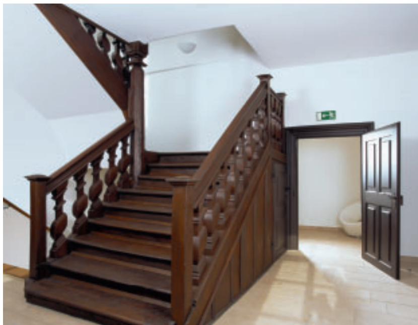
8 Eines der Turmzimmer im Herrenhaus nach der Sanierung.

Entsprechend führte die vorab erstellte Kartierung der Schäden am Naturstein zur Festlegung, was zu festigen, durch Vierungen zu reparieren und was zu erneuern war. Grundsätzlich unterblieben reine „Schönheitsreparaturen“. Neben den besonders von eindringendem Wasser beeinträchtigten Außengesimsen gab es beispielsweise auch Handlungsbedarf bei der Sandsteintreppe im Inneren. Hier waren die Stufen vor längerer Zeit unsachgemäß mit einem harten Zementmörtel überspachtelt worden. Davon befreite der Steinmetz die Treppe nun und brachte sie durch Ergänzungen in passendem Naturstein wieder in Ordnung.