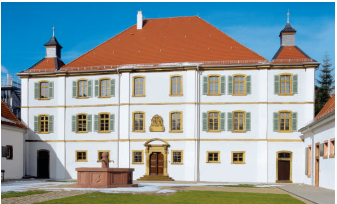
3 Das Herrenhaus nach der Sanierung.

Schließlich erwarb 1986 die Gemeinde das Anwesen. Sie veranlasste zwar 1994 die längst überfällige neue Dachdeckung und nahm kleinere Reparaturen vor, eine Gesamtinstandsetzung überstieg jedoch ihre finanziellen Möglichkeiten. Immer wieder gab es Überlegungen für eine Umnutzung des Anwesens. Manches erwies sich allerdings als nicht finanzierbar, anderes als nicht umsetzbar. Das Jahr 2007 brachte für Schloss Seehalde schließlich die Wende: Es wurde an einen neuen Eigentümer verkauft, der es in den beiden folgenden Jahren sanierte und zu einer Event- und Tagungsstätte umgestaltete.