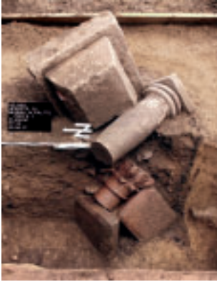
Bauteile der Jupitergigantensäule während der Ausgrabung, (Kurpfälzisches Museum, E. Kemmet)